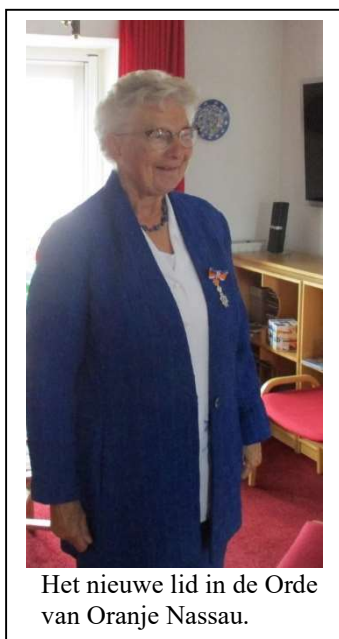
Het nieuwe lid in de Orde van Oranje Nassau.