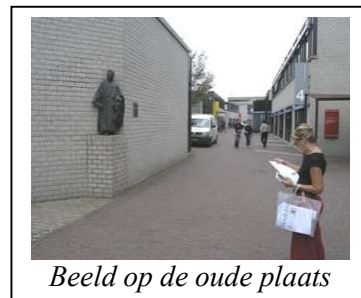
Beeld op de oude plaats

Omdat de gebouwen aan de Thomas van Aquinostraat gesloopt werden en het gebied een andere inrichting gekregen heeft, moest er ook voor het beeld van Titus Brandsma een andere plek komen. Ik ben vandaag eens gaan kijken hoe het er bij staat. Het heeft een prachtige plek gekregen dicht bij het Erasmusgebouw.