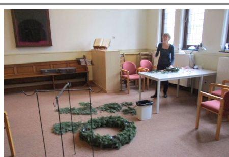
Vorbereidingen in de sacristie.