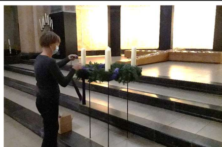
Vorbereidingen in de kerk.