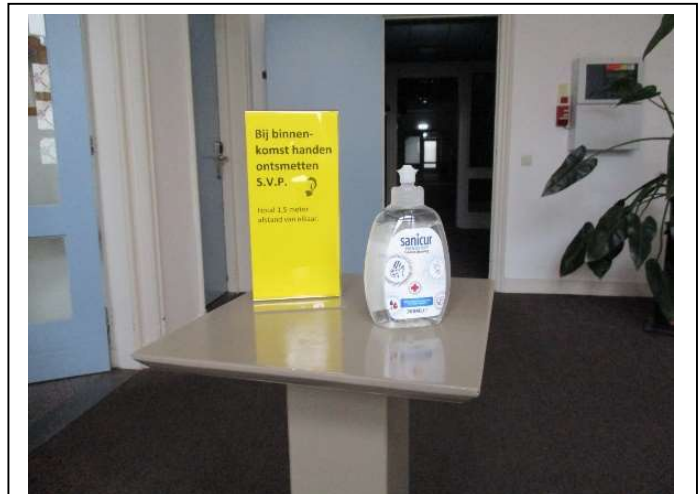
Bij binnenkomst via de voordeur aan de Stijn Buysstraat zult u dit tafereel tegen kunnen komen.

Volgende week vrijdag verwacht ik u in het wekelijkse 'teken van leven' de uitslag van de bestuursvergadering te kunnen mee delen.