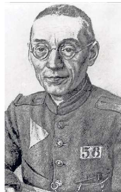
Titus Brandsma, getekend door een medegevangene in kamp Amersfoort.