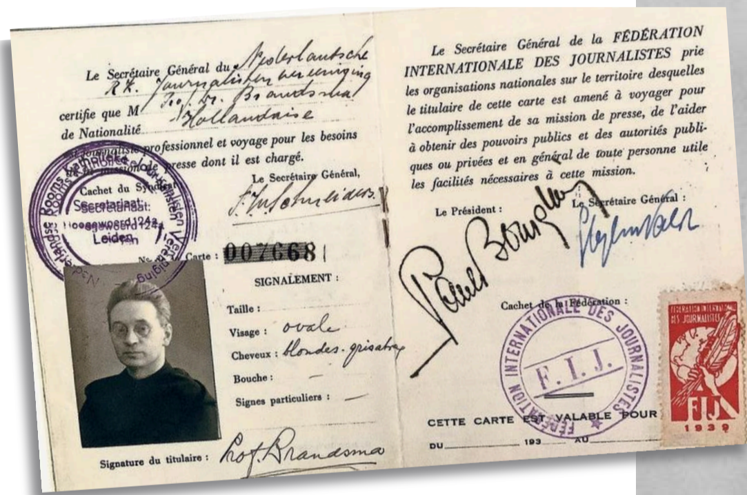
De perskaart van Titus Brandsma

Ondanks deze miserabele behandeling was Titus Brandsma voor zijn omgeving een belangrijke steunpilaar, vertelden medegevangenen later. Met opbeurende woorden wist hij lichtpuntjes te creëren in het zware kampbestaan.