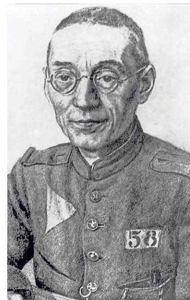
Titus Brandsma, getekend door een medegevangene in kamp Amersfoort.