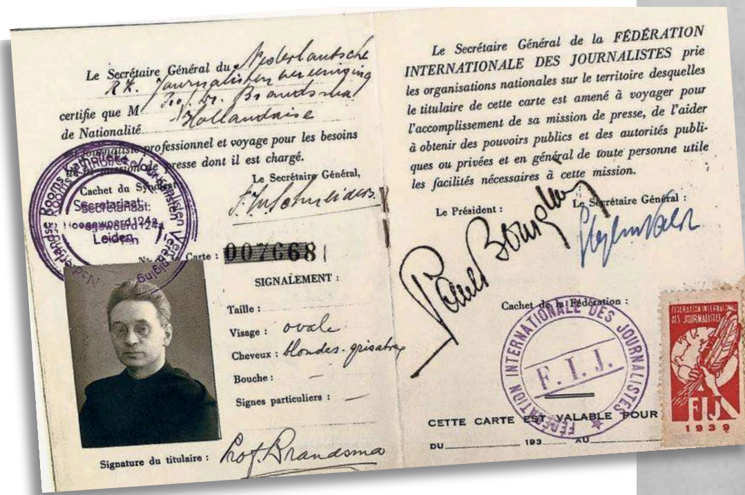
De perskaart van Titus Brandsma

Ondanks deze miserabele behandeling was Titus Brandsma voor zijn omgeving een belangrijke steunpilaar, vertelden medegevangenen later. Met opbeurende woorden wist hij lichtpuntjes te creëren in het zware kampbestaan.