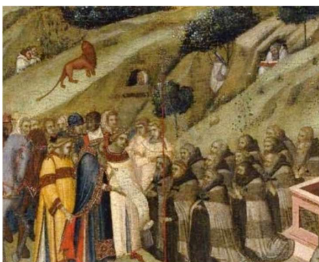
Fragment van een schilderij van Pietro Lorenzetti over het aanbieden van de Karmelregel aan de Karmelieten op de berg Karmel.