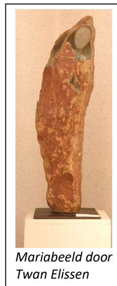
Mariabeeld door Twan Elissen

Aanmelding is nog mogelijk (via titusbrandsma@karmel.nl ). Dan krijgt u de Zoomlink toegestuurd. Aanvang: 20.00 uur. (Kosten € 5.)