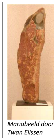
Mariabeeld door Twan Elissen

Aanmelding is nog mogelijk (via titusbrandsma@karmel.nl ). Dan krijgt u de Zoomlink toegestuurd. Aanvang: 20.00 uur. (Kosten € 5.)