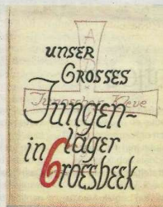
▲ Het dagboek van Karl Leisner over een zomerkamp voor Kleefse jeugd in Groesbeek (1934).

Brandsma stond onder meer pal voor de persvrijheid, Leisner voor de katholieke jeugdbeweging.