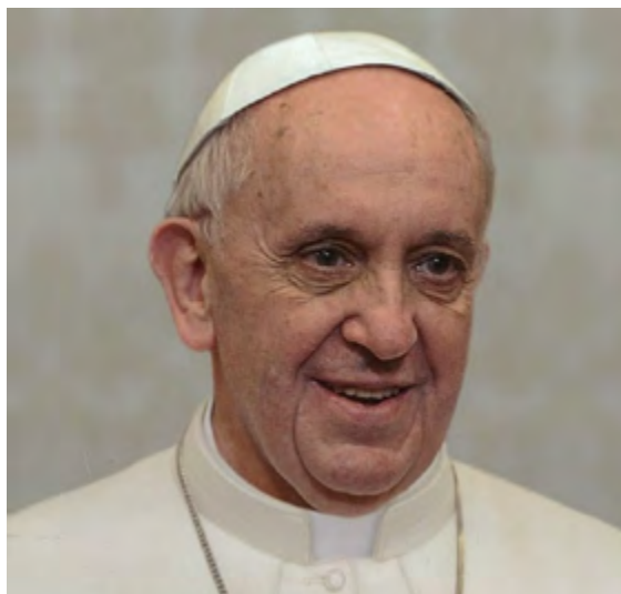
▲ Foto: Paus Franciscus

Voor ons Vrienden is dit vreugdevolle bericht een bevestiging van wat wij altijd al vermoedden en hoopten. Meteen na het overlijden van Titus Brandsma in Dachau werd hij door talloze mensen reeds heilig genoemd. Deze stemmen zijn, ook na zoveel jaren, nooit verstomd. We wensen dat juist nu in deze tijd, waarin vrede, integriteit en waarheid zo onder druk staan, zijn leven een inspiratie mag zijn.